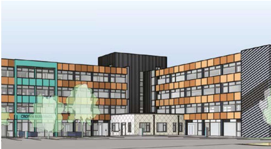
Datblygiad Adeiladau'r Goron

Mae Cyngor Wrecsam yn datblygu Adeiladau'r Goron i greu cyfleuster modern a fydd yn gartref i dimau gofal cymdeithasol ac iechyd integredig a chyfleuster lechyd a Lles Cymunedol.